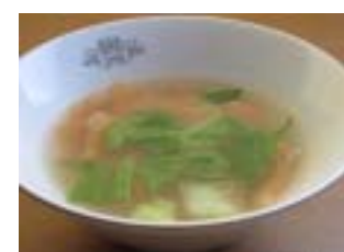
△めんべい汁 by 豚將軍

イメージ (何をイメージして作りましたか?) デンプンをおまかせへ。春～ セールスポイント (この料理の特徴、売りなど) 名産品の餅粉をスイーツに! しかしやっぱ餅粉。主役は餅粉が美味しい。