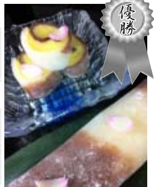
△牛皮カスタードロール by ふれあいセンター