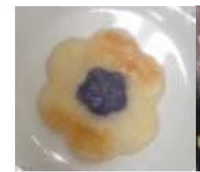
△フラワーポテトマップ by 夢レストランの会

イメージ (何をイメージして作りましたか?) お味噌汁代わりにめんべい汁。簡単でうまくて美味しい。ぷるぷる食感のめんべいが楽しめます。