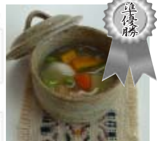
△小清水旨いもん たっぶりあんかけ by 浜小清水野菜クラブ

イメージ (何をイメージして作りましたか?) 小清水の秋、豊かな食材(これぞ小清水をイメージしました) セールスポイント (この料理の特徴、売りなど) 小清水で採れた野菜とオホーツク産でとれるホタテなどと、お母さん善きせたと、熱いうちに でんぶのみならず、小清水産の良質な野菜を使うことによって素材本来の味を感じることが出来ます。懐かしいような安心感がある素材な味わいです。