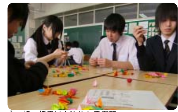
△一折一折思いを込めた千羽鶴

2月22日に発生したニュージーランド地震により被災したリンウッド高校に、姉妹校として17年間交流を続けている小清水高校の生徒が、お見舞いとしてメッセージ・合唱のVTR、千羽鶴を送りました。 また、募金活動を行い、企業等からご協力いただいた義援金を送金する予定でしたが、リンウッド高校より「募金は、東日本大震災で被災された方々のために使ってくださいを希望します。」とのご厚情をいただいております。 小清水高校の生徒一同は、リンウッド高校のご厚情に感謝すると共に、ニュージーランド地震及び東日本大震災による被災地の一日も早い復興を祈っています。