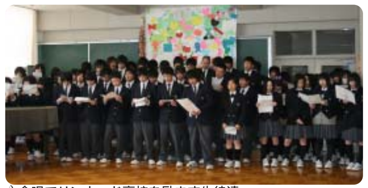
△合唱でリンウッド高校を励ます生徒達