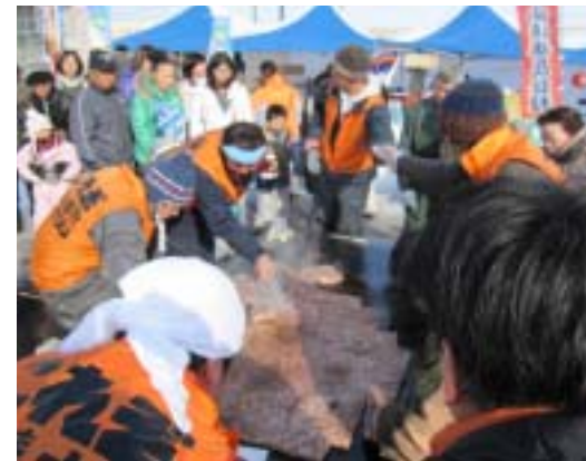
△「小清水屋台村」巨大でんぶだんご