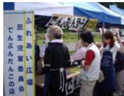
昨年のふれあい広場の様子

【お問い合わせ先】 小清水町民生児童委員協議会事務局(役場保健福祉課) ☎(62)4473