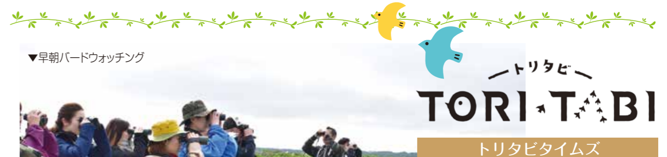
▼早朝バードウォッチング