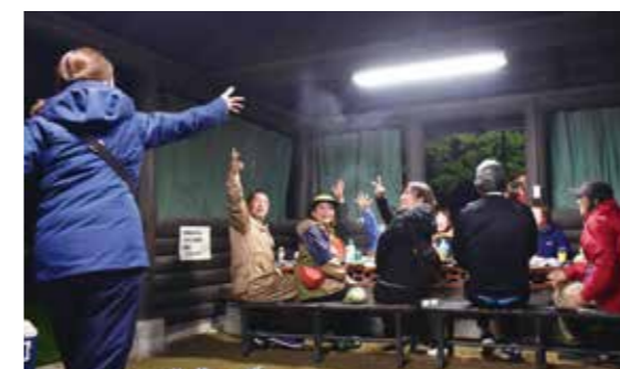
▲白熱ジャンケン大会