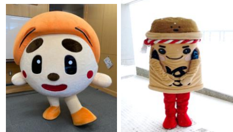
町の人気者『でん坊』と『ほがじゃ君』この日のために数日前から待機していましたが…残念！

また、本事業に際し、会員、役場、企業の皆様には物品の借用や運搬等でご協力をいただきました。引き続きご支援・ご協力をお願いいたします。