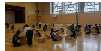
2年生 段ボールベット体験