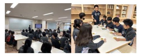
3年生 講話・災害非常食体験