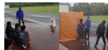
1年生 消火器・煙体験

お忙しい中、防災学校に来校された消防職員の皆さん、役場職員の皆さん、ありがとうございました。