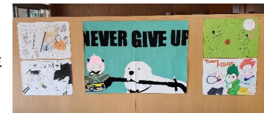
文化部作成 部活動応援ポスター (ラウンジに掲示)

壮行会の最後に文化部から各部活動に応援ポスターが渡されました。管内大会を勝ち進み、全道大会、全国大会と上位大会に進出できるよう応援しています。