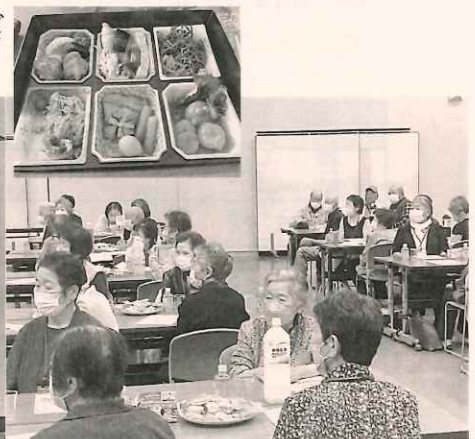
マジックショーの様子