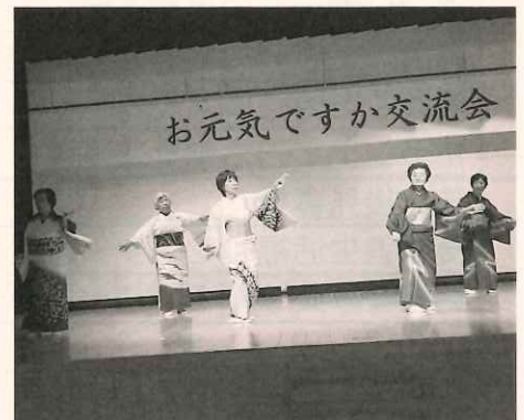
ことぶき学園舞踊クラブ