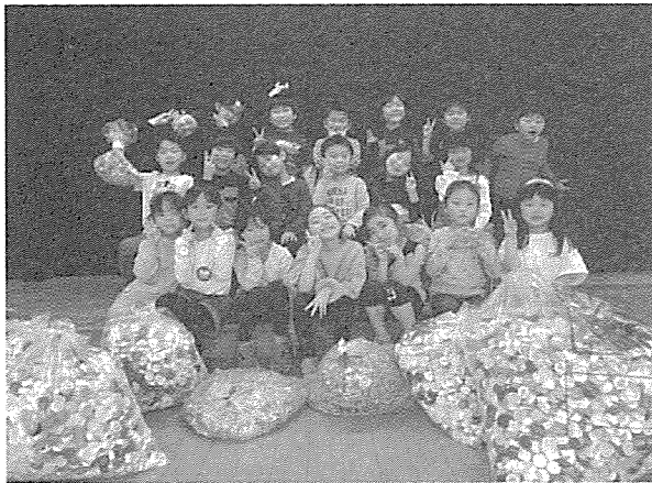
(小清水保育所の皆さん)

毎年、自治会やボランティア団体、学校、個人の方など、多くの町民の皆様がリングプルやエコキャップの収集にご協力いただいています。今回は保育所・小学校からたくさんのおキャップ等が届きました。今後も引き続き、皆様のご協力をお願いします。