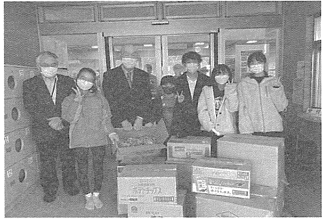
(小清水小学校児童会の皆さん)