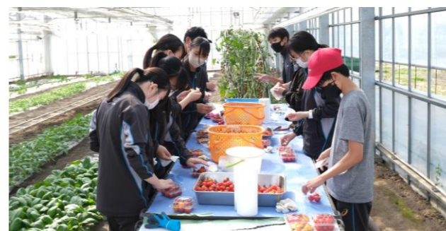
トマトの選果をしています。

今月のJAこしみずさんの協力で2年生の収穫体験、3年生の施設見学を行いました。いつもご協力ありがとうございます。