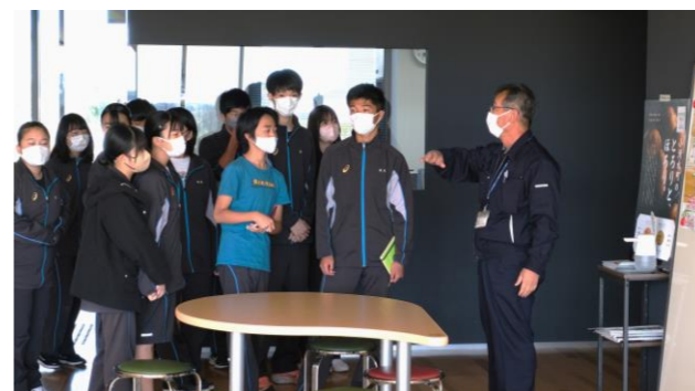
所長さんの説明を聞いています。