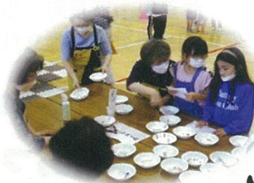
小清水町学童夏祭り

保護司会は、各学校を訪問して、学校の様子を伺うと共に「作文コンテスト」の応募をお願いしています。斜里中学校から、「犯罪や非行のない社会づくり」を題材に8作品応募してくれました。ありがとうございます。