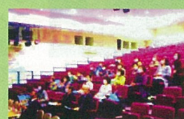
小清水町愛ホール