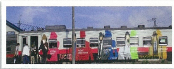
JR清里町駅に停車中の ルパン三世が描かれた列車