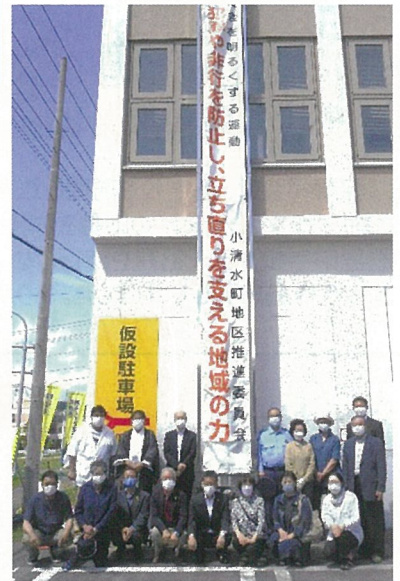
小清水町 社明の旗立て作業が 終わって懸垂幕の前で記念撮影