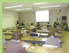
斜里町ゆめホール知床