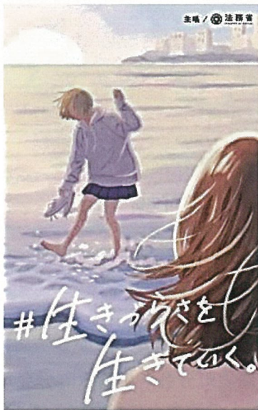
社会を明るくする運動の ポスター