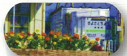
清里町の保護司と更生保護女性会が 駅の花壇に植えたマリーゴールド