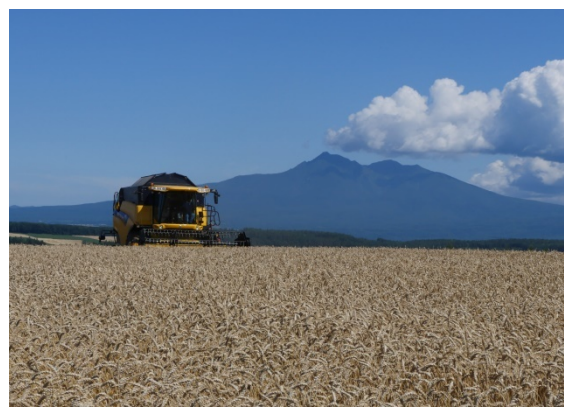
（↑大規模な畑の小麦を収穫するため、大きなコンバインが畑を走ります。）