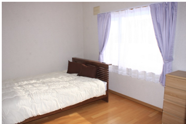
寝室（ダブルルーム）