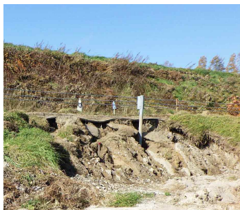
被害のあった町道（旭地区）

台風による道路被害の復旧に要する費用として、町道等修繕料及び町道災害復旧整備工事請負費の追加計上により、歳入歳出予算の総額にそれぞれ、2654万1千円を追加し、歳入歳出予算の総額をそれぞれ58億3459万7千円としたものです。