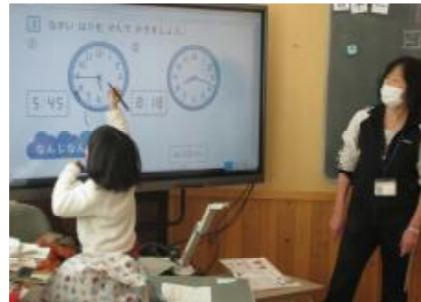
電子黒板に教科書を10倍にして映しています

これからも、私たちの身の回りには便利な道具がどんどん増えてくるでしょう。子ども達には、便利な道具には人を楽にしたり、楽しくしたりするようなプラスの面ばかりではなく、マイナスの要素もあることを知って欲しいと話しました。そして、マイナス面を減らして、プラス面を増やすのは私たちの道具の使い方次第ということ子ども達に知っていて欲しいと思います。