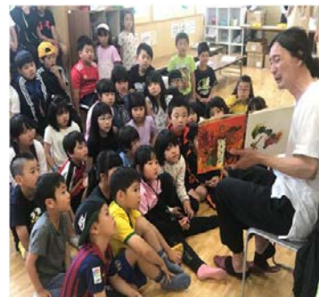
読み聞かせの様子