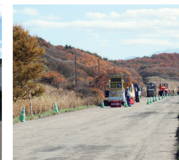
オホーツク海岸道路