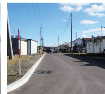
浜小清水市街第1南通り