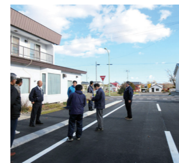
小清水市街西8丁目通り